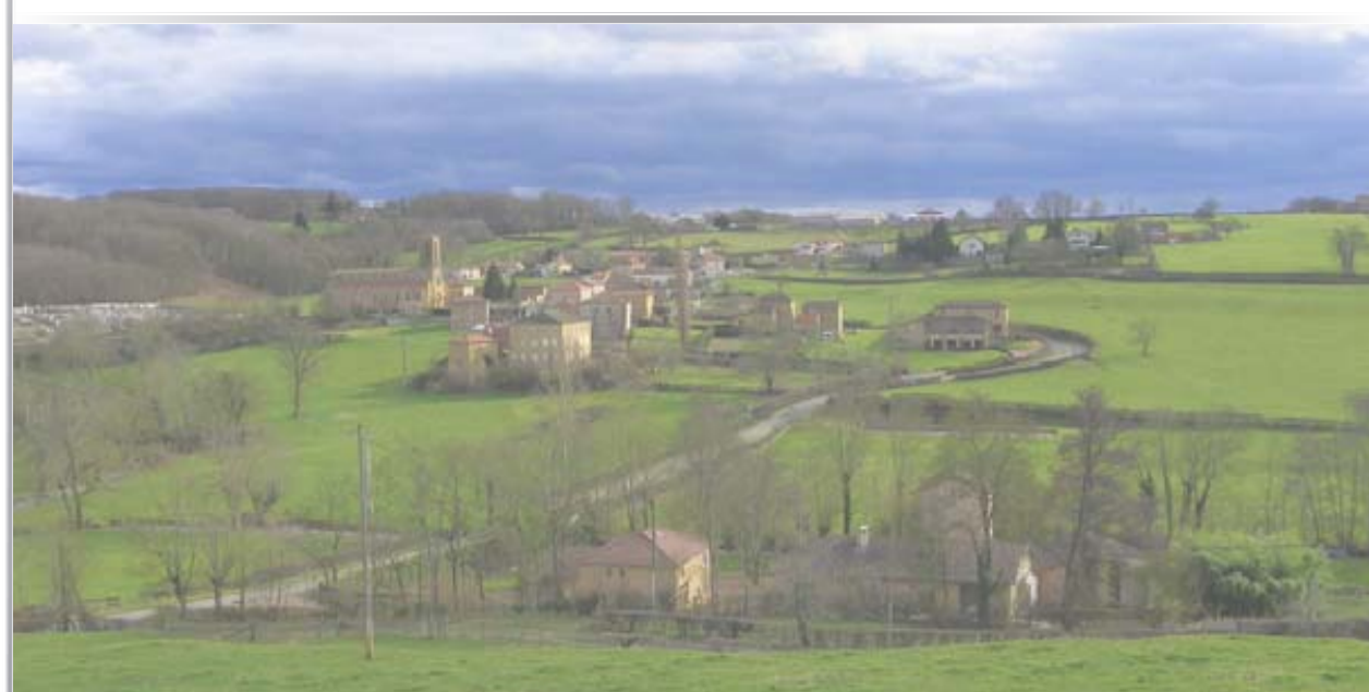
Planche Globale - Echelle : 1/5000

Plan local d'urbanisme : - Prescription du Plan Local d'Urbanisme par délibération en Conseil municipal du 10 Janvier 2012, et complétée par la délibération du 23 Octobre 2012 - Arrêt du projet de PLU par délibération du Conseil Municipal en date du 30 Août 2016 - Approbation du projet de PLU par délibération du Conseil Municipal en date du 04 Juillet 2017 Vu pour être annexé à la délibération du Conseil Municipal en date du 04 Juillet 2017