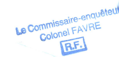
SCHÉMA DIRECTEUR D'ASSAINISSEMENT